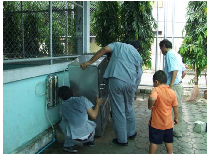
เก็บเครื่องเข้าตำแหน่งเดิม