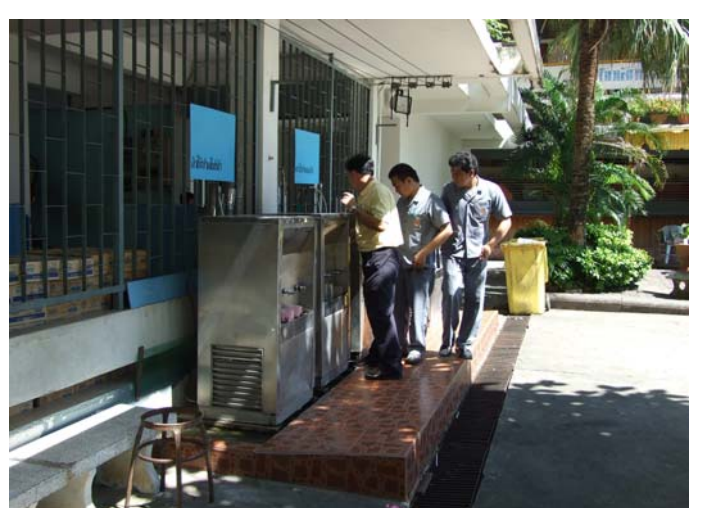
ทำการเดินท่อสายกราวด์ ติดตั้งแท่งกราวด์ตามจุดที่เหมาะสม และตรวจสอบการทำงานของเครื่องอีกครั้ง