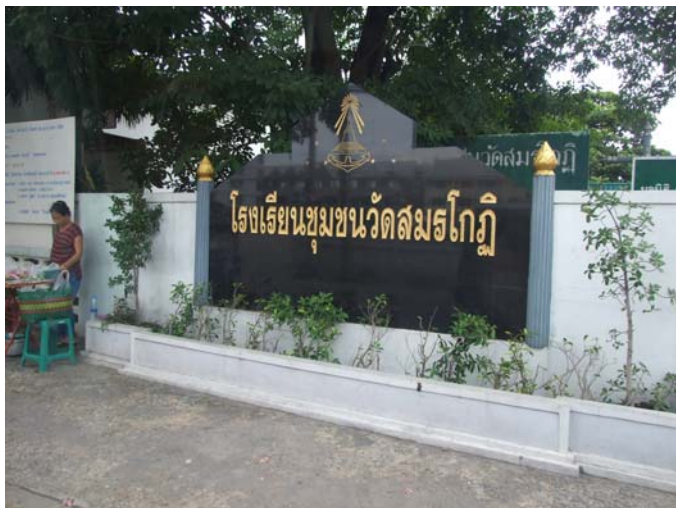
โรงเรียนสมร โกฏิ