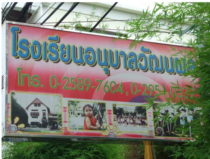
โรงเรียนอนุบาลวัฒนผล