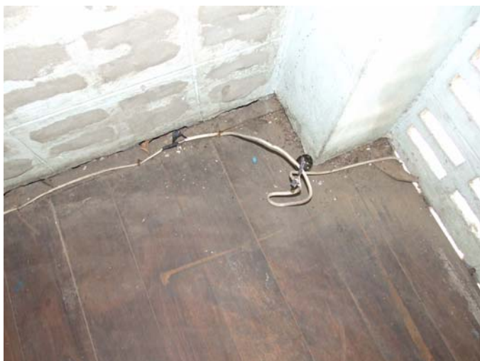
สายไฟตู้น้ำเย็นที่ต่อเข้ากับเบรกเกอร์ ก่อนการปรับปรุง