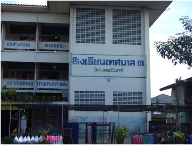
โรงเรียนเทศบาล 3 วัดนครอินทร์