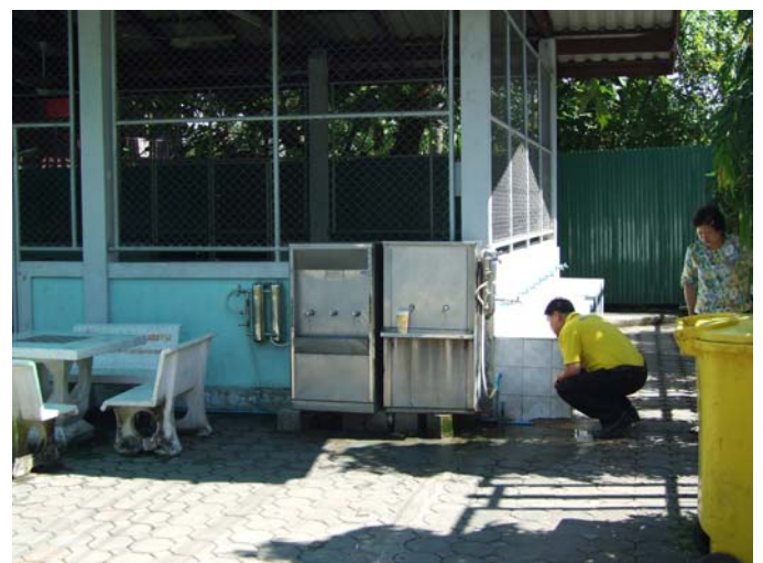
สำรวจเพื่อหาจุดที่ทำการติดตั้งสายดิน