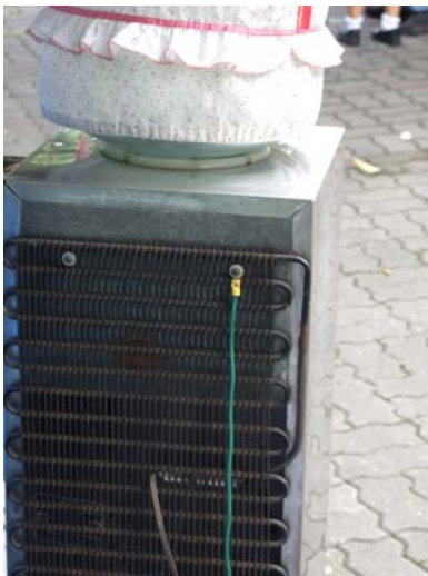
จุดยึดสายดิน