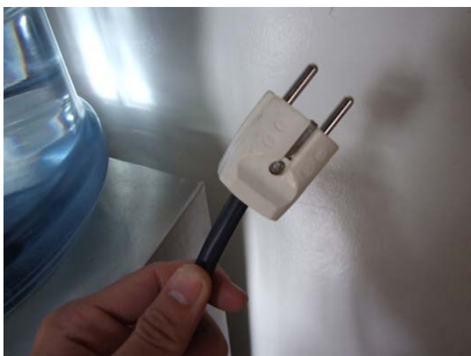
สายไฟต้องให้ปลั๊กตัวผู้ที่มีสายดินด้วย