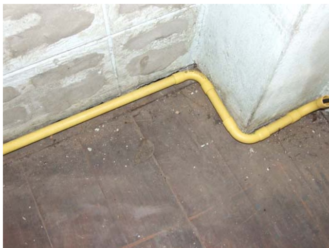
เดินท่อร้อยสายป้องกันสายไฟชำรุดและเปลี่ยนสายไฟใหม่