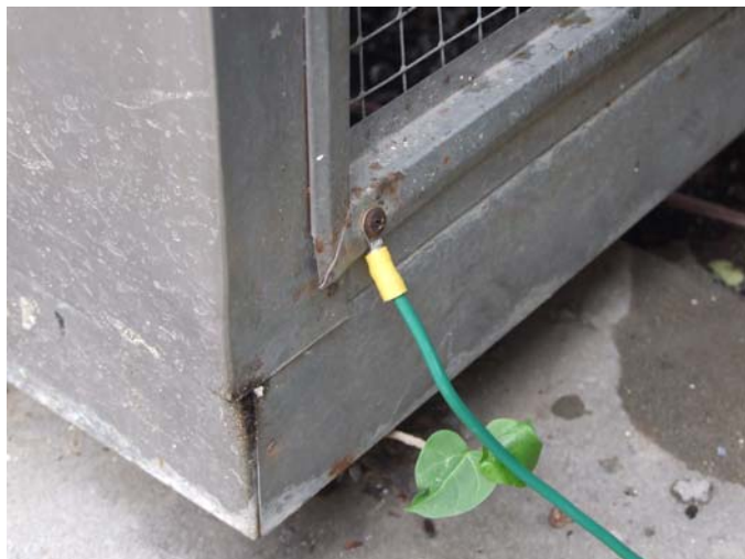
เปลี่ยนสายใหม่