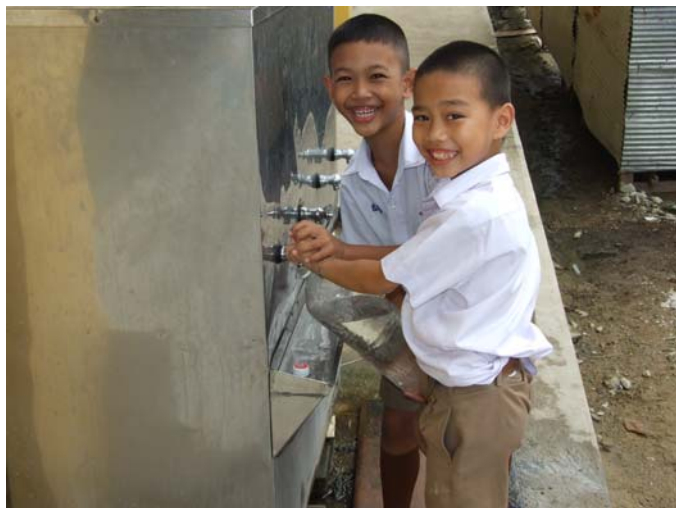
ตู้น้ำที่ไม่มีสายดินหรือชำรุด เป็นอันตรายต่อผู้ใช้ได้