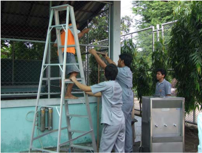
ติดตั้งแผงกราวด์