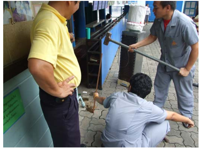
ติดตั้งแท่งกรวดขึ้นมาใหม่