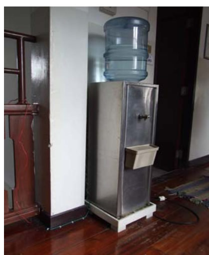
หลังการติดตั้งเสร็จเรียบร้อย