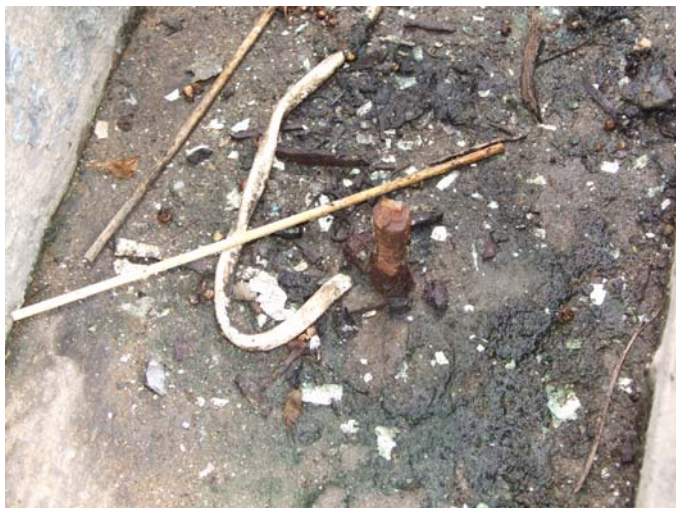
สายดินก่อนทำการปรับปรุงซึ่งอาจทำให้เกิดอันตรายได้