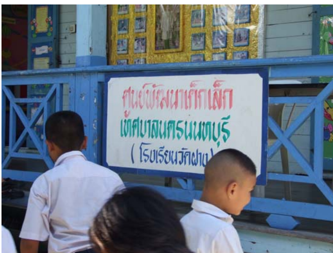
โรงเรียนวัดฝาง