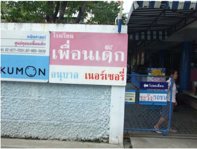
โรงเรียนอนุบาลเพื่อนเด็ก