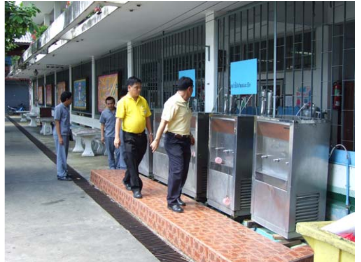
อาจารย์ได้สำรวจการติดตั้งตู้น้ำเย็นและตรวจเช็คสายดิน