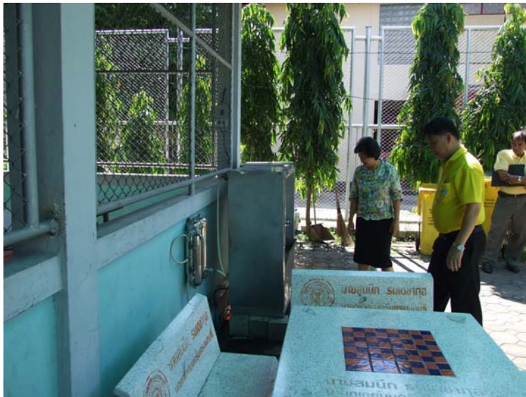
เปิดเครื่องหลังการติดตั้งสายดินเพื่อตรวจสอบการทำงานของเครื่อง