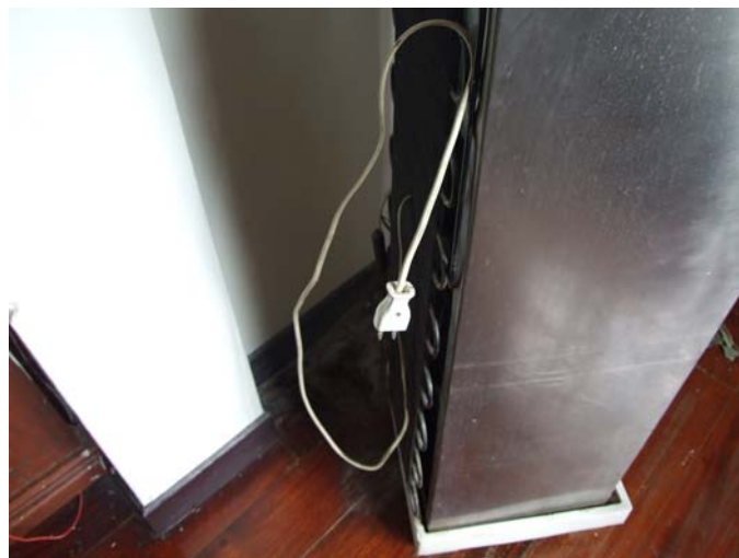
สายไฟตู้น้ำเย็นก่อนการปรับปรุง